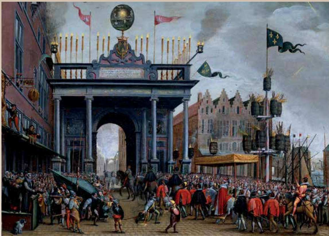
Intocht van Frans van Anjou in Antwerpen. Anjou kwam in aanmerking om de Republiek te leiden als vorst na het afzetten van Filips II. Schilderij gesigneerd met de letters MHVH, ca. 1582-1600.

overleden Willem II, getrouwd met een Engelse koningsdochter, uit te sluiten van het stadhouderschap en alles te doen om te voorkomen dat zo iemand kapitein- of admiraal-generaal van de Verenigde Nederlanden werd. Met een mathematisch opgezette bewijsvoering toont De Witt aan dat de Staten van Holland volledig in hun recht stonden. Ze hadden ook 'eigenmachtig' al op 19 april 1581 Filips vervallen verklaard van de landsheerlijkheid.